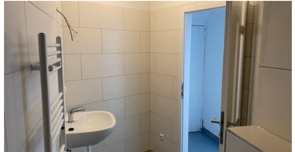
Duschbad 21374 2. Ansicht