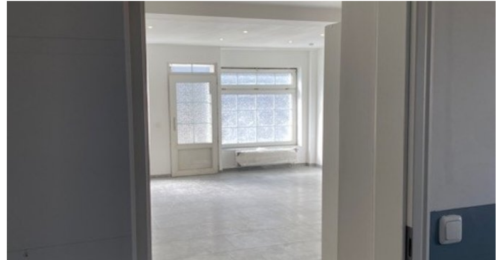
21374 Ansicht vom Lager