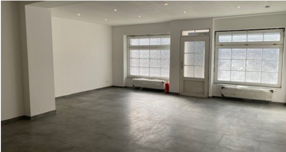
21374 2. Ansicht Verkaufsraum