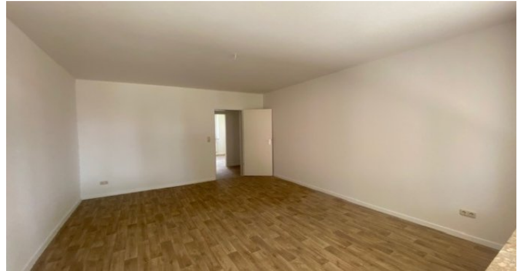
Wohnzimmer weitere Ansicht