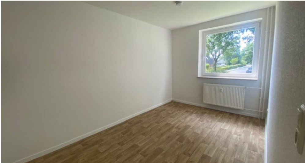
Zimmer 3 weitere Ansicht