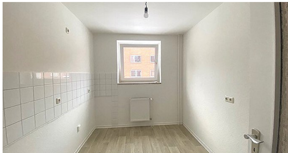
Küche weitere Ansicht2