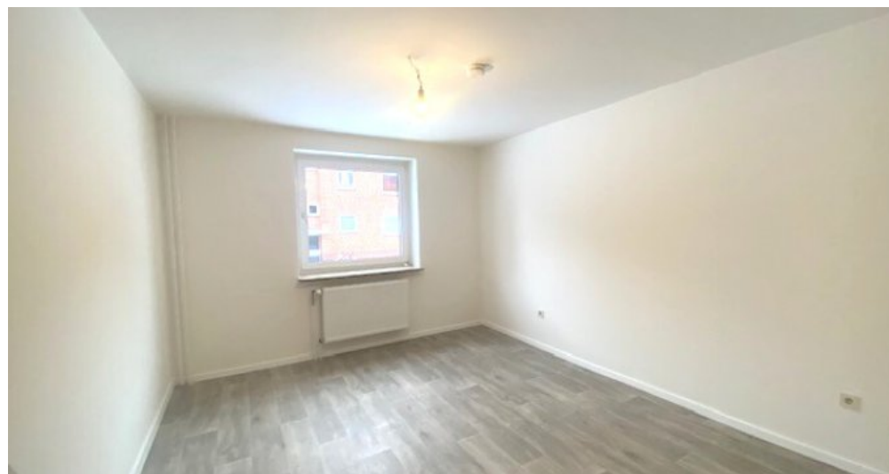
Schlafzimmer weitere Ansicht