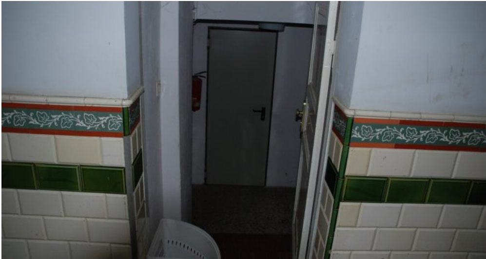
Eingang im Haus