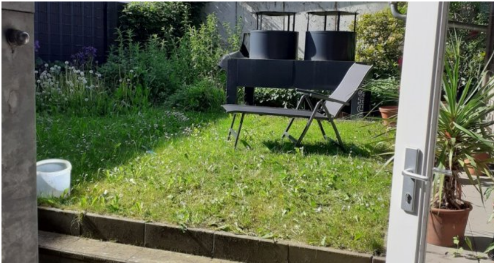
Zugang Terrasse Gartenbereich