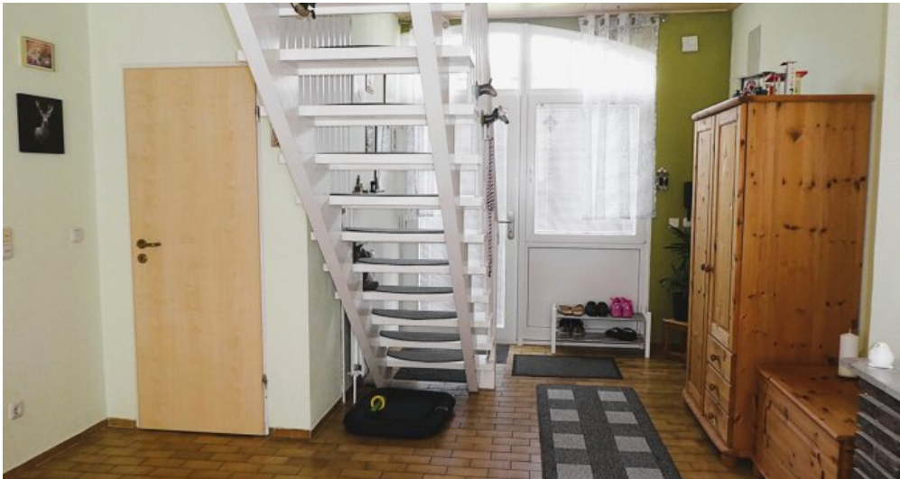
EG Diele mit Gäste-WC