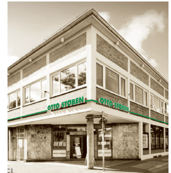
BÜRO KIEL Schülperbaum 31

Unsere Hotline bietet allen, die ihre Immobilie verkaufen, verwalten oder vermieten lassen wollen oder Fragen rund um das Immobiliengutachten haben, eine kostenfreie, unkomplizierte und fachkompetente Beratung.