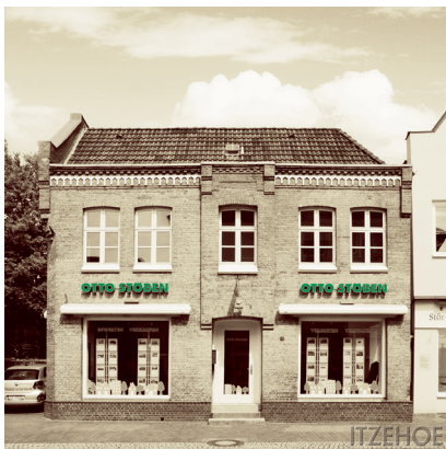
BÜRO ITZEHOE Kirchenstraße 2

Wer die Kombination aus einer mittelgroßen Stadt und einer wunderschönen Landschaft unmittelbar an der Stör bevorzugt, sollte hier eine Immobilie besitzen. Wir haben das fachliche Know-how und die regionale Kompetenz. In einer der ältesten Städte Holsteins befindet sich unser Regionalbüro Itzehoe in der Kirchenstraße 2. Nachdem wir 1997 unser zweites Regionalbüro in Itzehoe eröffneten, konnten wir 2012 neue und größere Räume beziehen. Mit jahrelanger Erfahrung und Umgebungskennntnissen stehen wir unseren Kunden in den Bereichen Verkauf und Vermietung von sowohl Wohn- als auch Gewerbeimmobilien und Kapitalanlagen, Bewertung und Gutachtenerstellung sowie Verwaltung von Immobilien inklusive der WEG-Verwaltung zur Seite.