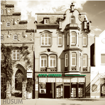
BÜRO HUSUM Markt 5

Zwischen Deich und Schafen in der grauen Stadt am Meer liegt unser Regionalbüro Husum direkt am betriebsreichen Marktplatz. Hier in unserem Regionalbüro bieten unsere Mitarbeiter seit 2009 alle Leistungen an Maklertätigkeiten. Hierzu gehören der Verkauf und die Vermietung von sowohl Wohn- als auch Gewerbeimmobilien und Kapitalanlagen, die Bewertung und Gutachtererstellung sowie die Verwaltung von Immobilien inklusive der WEG-Verwaltung.