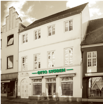
BÜRO FLENSBURG Große Straße 46

In der nördlichsten kreisfreien Stadt Deutschlands an der Grenze zu Dänemark liegt unser Regionalbüro Flensburg in der „Große Straße 46“.