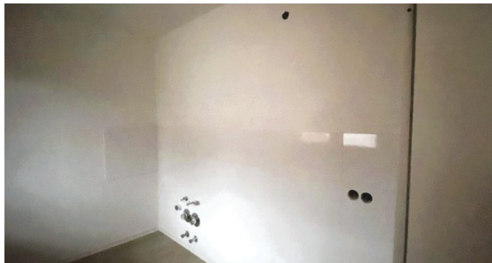
Küche nur mit Anschlüssen