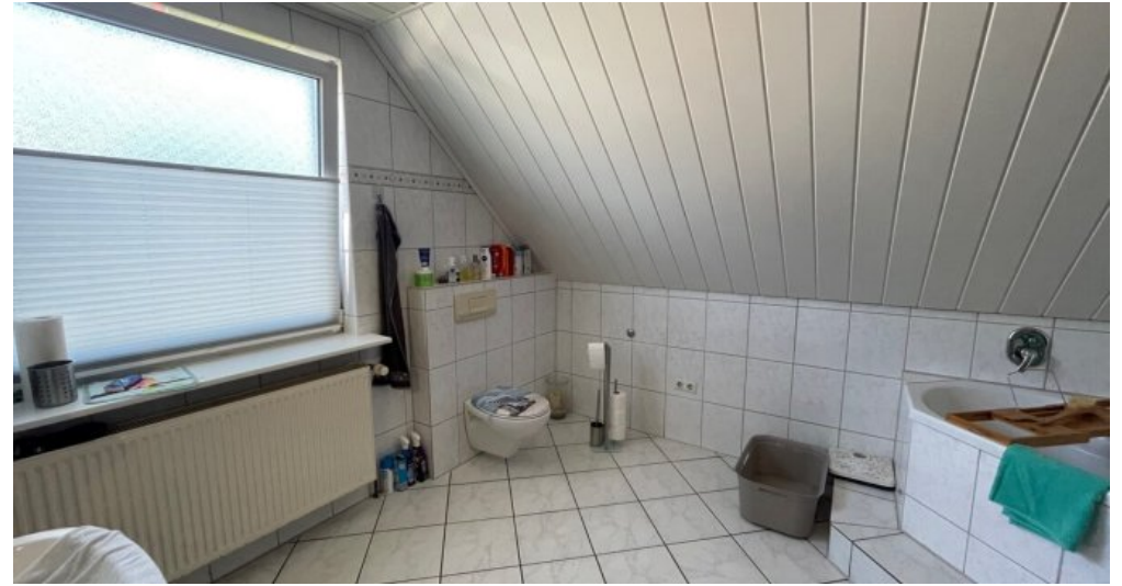
Badezimmer 1. OG