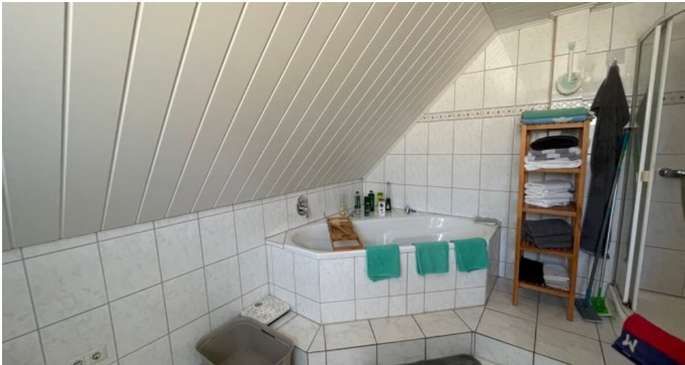
Andere Ansicht Badezimmer