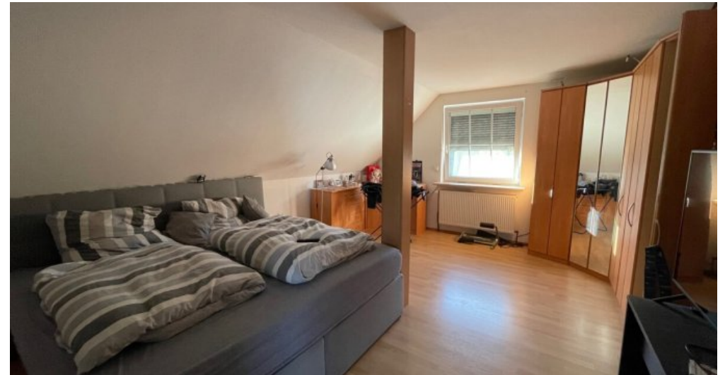
Schlafzimmer 1. OG