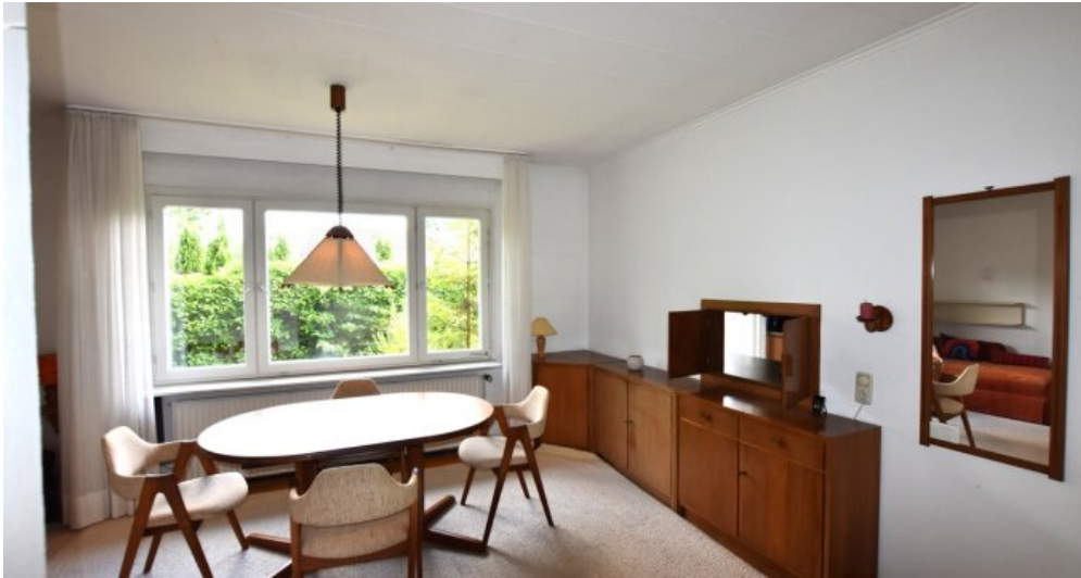
Essbereich mit Durchreiche