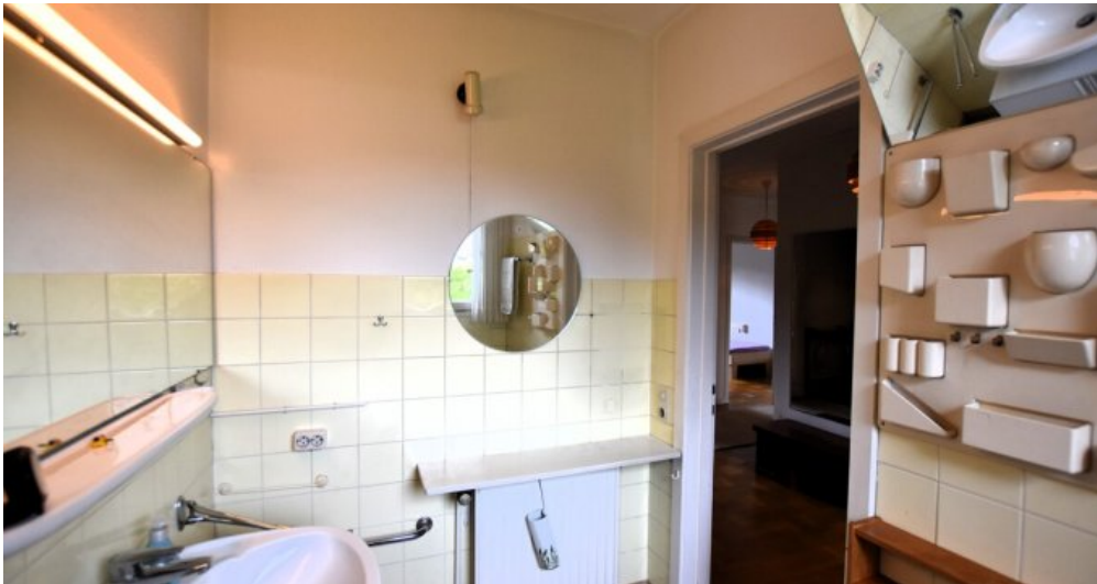
Badezimmer weitere Ansicht