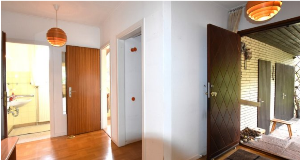
Diele weitere Ansicht