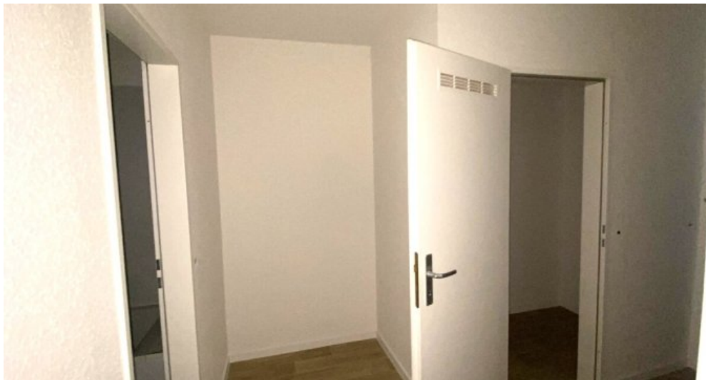
Flur mit Abstellkammer