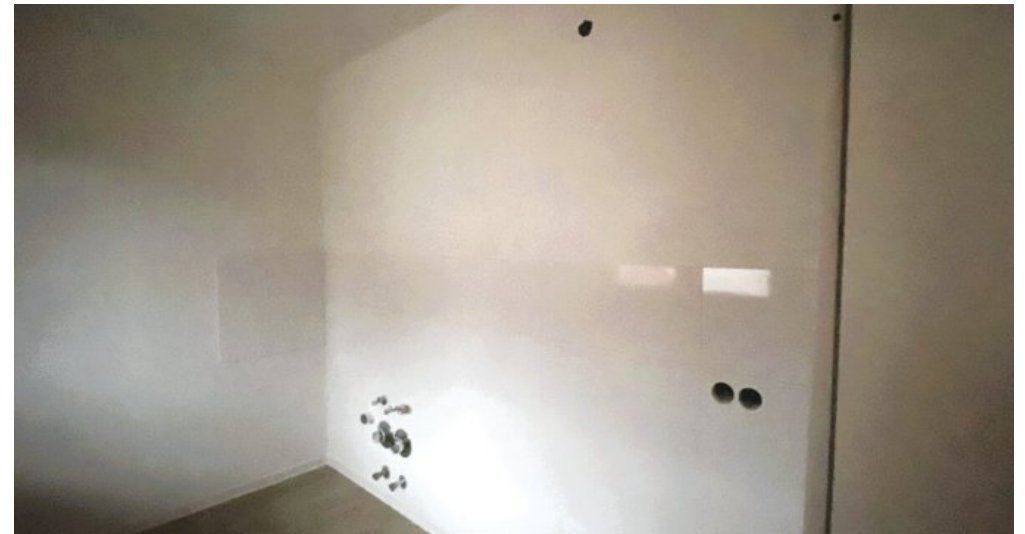
Küche nur mit Anschlüssen