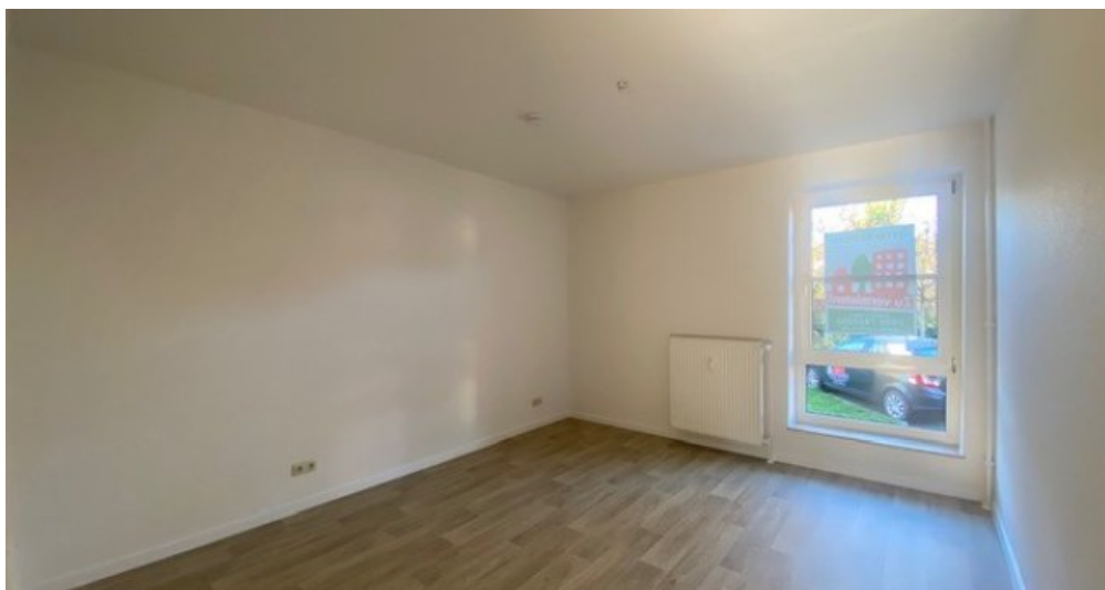
Schlafzimmer weitere Ansicht