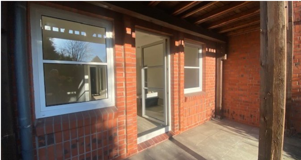
Terrasse weitere Ansicht