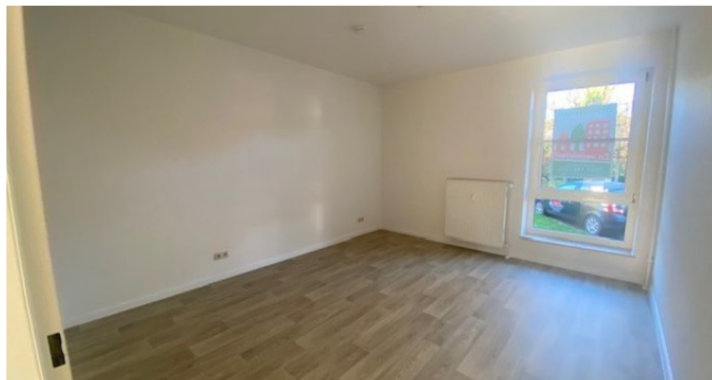
Schlafzimmer weitere Ansicht2