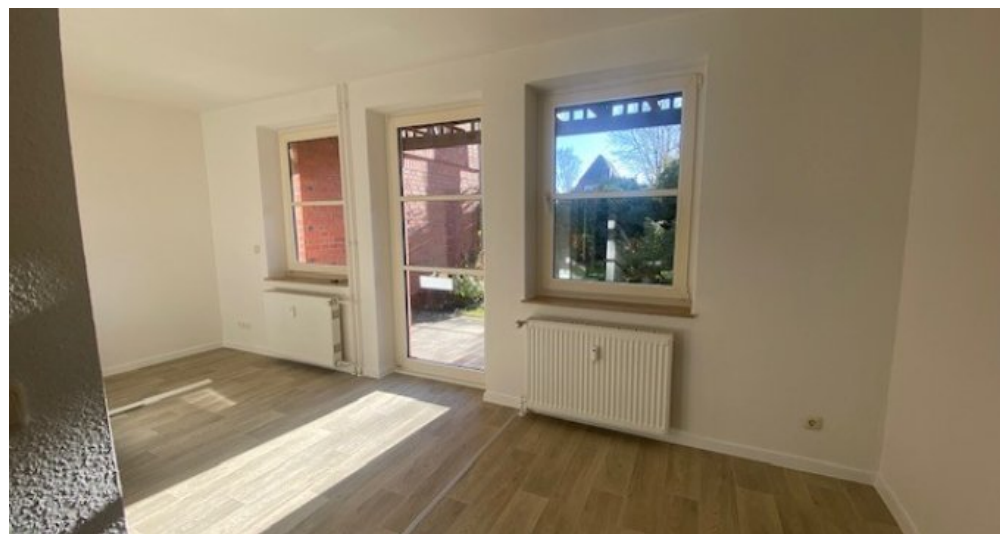
Wohnzimmer weitere Ansicht