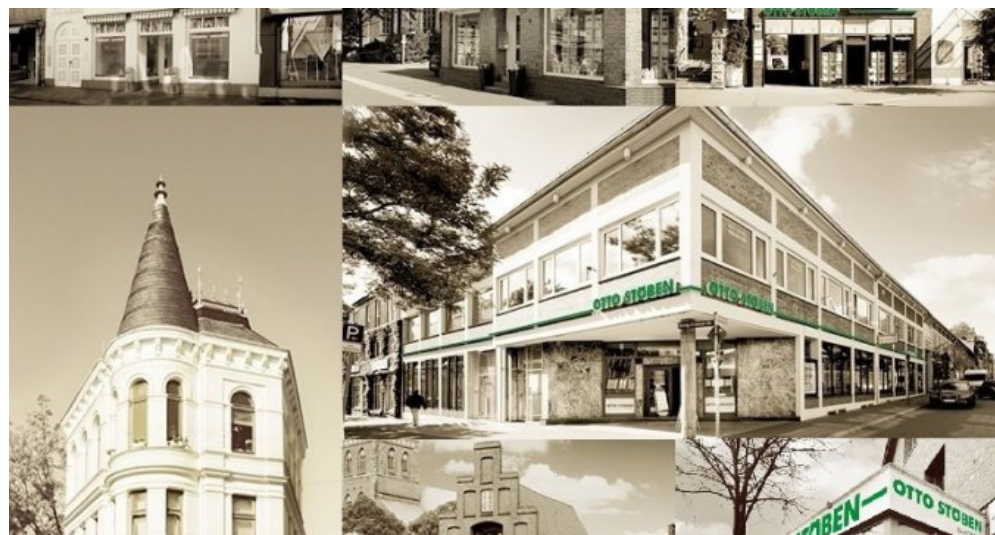
Otto Stöben GmbH